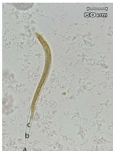
Gambar 2. Larva 2 A. galli . (a) filamen, (b) perpanjangan selubung ekor, (c) ujung ekor

Panjang L2 pada penelitian ini (352,24 µm) sama dengan hasil penelitian Ramadan dan Znada (1992) yang menyebutkan bahwa panjang L2 A. galli pada ayam broiler Ross berkisar antara 300-1000 µm. Ramadan dan Znada (1992) menyatakan bahwa perbedaan ukuran cacing mungkin disebabkan oleh perbedaan kerentanan jenis ayam.